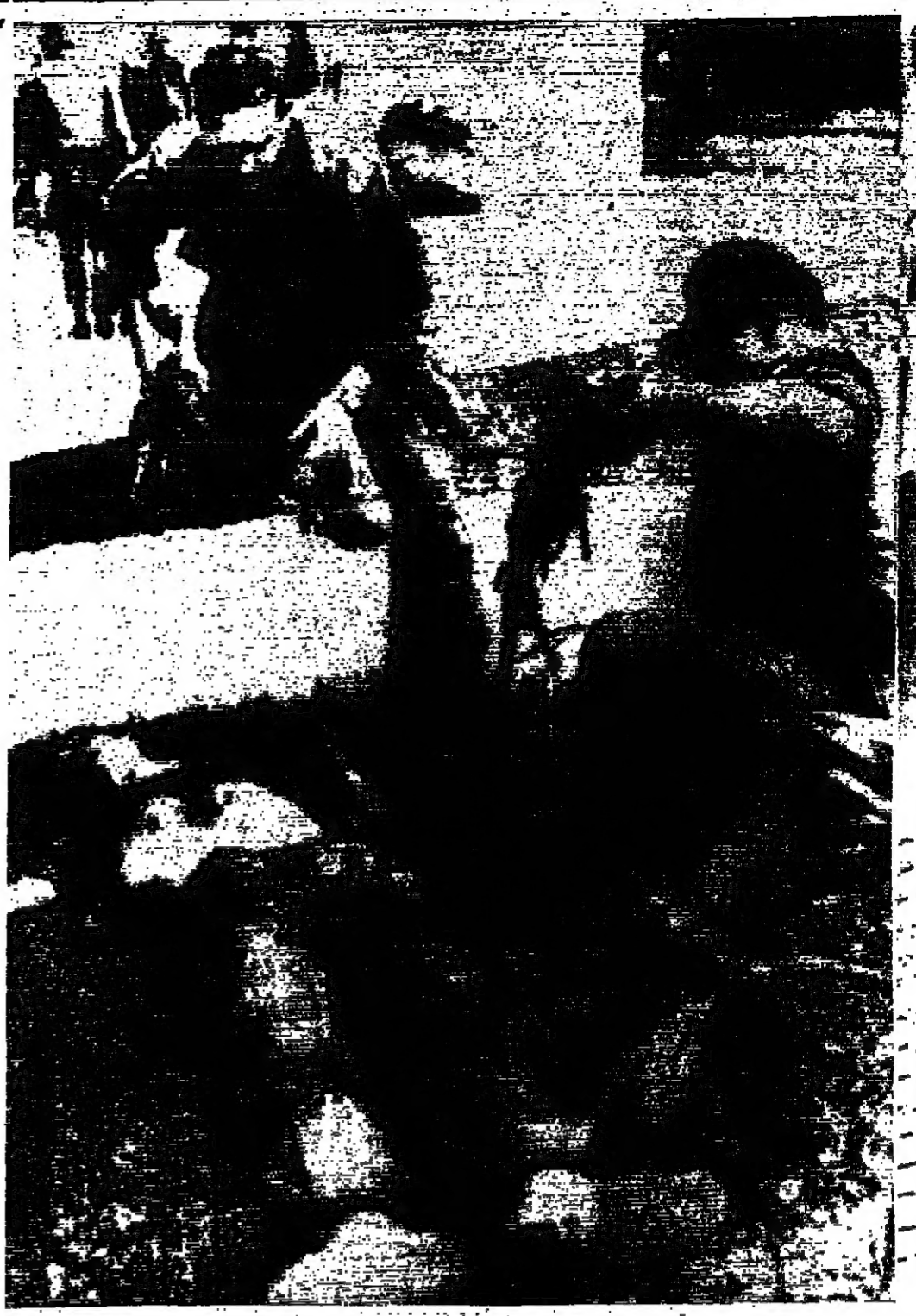
مشهد من مشاهد الحرب في لبنان - جنود أمريكيون من حراس السفارة الأمريكية في سايون ، يمحسون سلاحا كان يملكه أحد جنود ( القيثونج ) بعد ان اردوه قتيلا . والمقر داخل ساحة السفارة